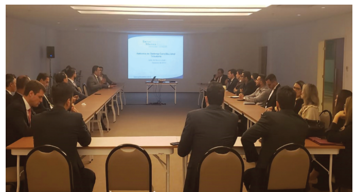
REUNIÃO DA SECCIONAL