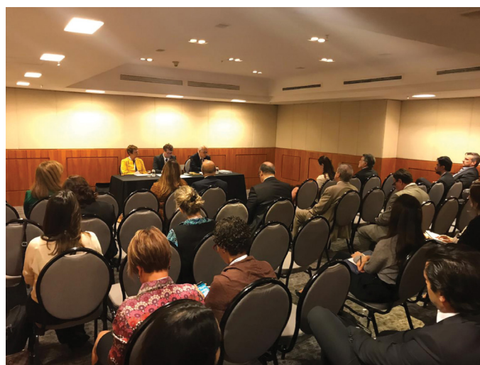
REUNIÃO DO COMITÊ SP