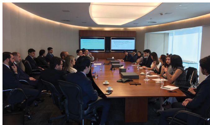
REUNIÃO DO COMITÊ