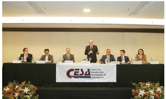
III ENCONTRO N-NE

Em 04/10/2019, o CESA Nacional realizou o III Encontro Norte-Nordeste de Sociedades de Advogados, em Fortaleza/CE.