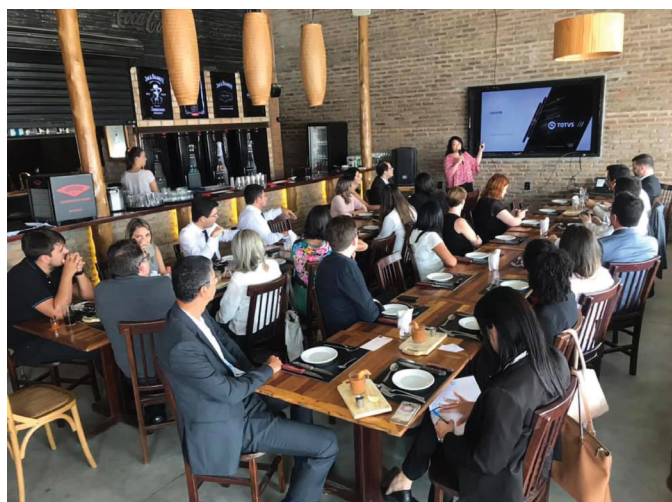
REUNIÃO DA SECCIONAL