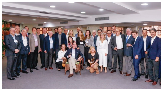
I ENCONTRO DAS SOCIEDADES DE ADVOGADOS DO SUL E SUDESTE

11 a 13/11 – Evento conjunto do Comitê de Ensino Jurídico e Relações com Faculdades e a AASP - “TEMAS ATUAIS DE DIREITO BANCÁRIO”.