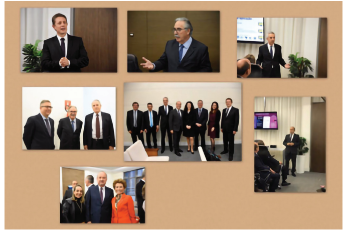
REUNIÃO NO ESCRITÓRIO GLOMB ADVOGADOS ASSOCIADOS

Tema: “A Lei Geral de Proteção de Dados para as Sociedades de Advogados”