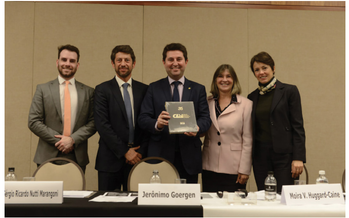
REUNIÃO DE ASSOCIADAS