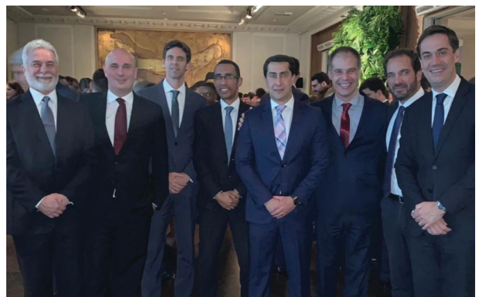
REUNIÃO DA SECCIONAL

03/12/2019 – Participação na Festa Anual de Encerramento das Atividades do CESA nacional, no Jockey Clube de São Paulo, com a presença de vários diretores do CESA/MG e de advogados de Minas Gerais.