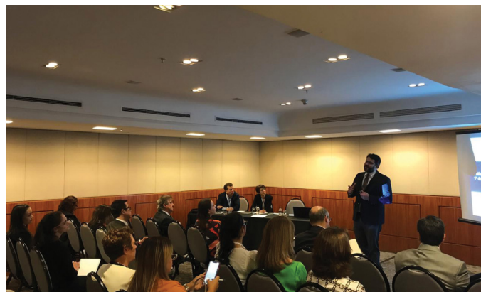
REUNIÃO DO COMITÊ SP