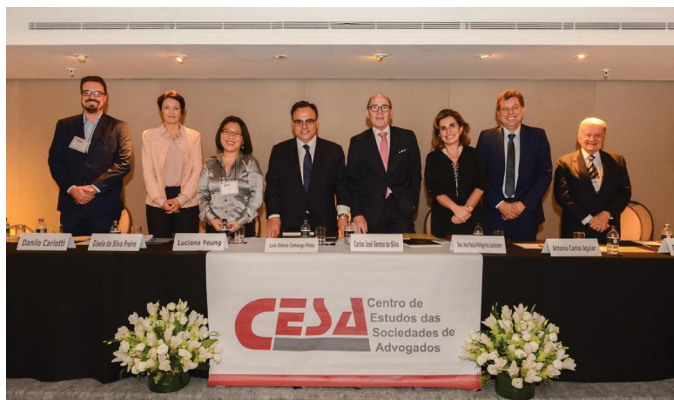
REUNIÃO DE ASSOCIADAS DO CESA