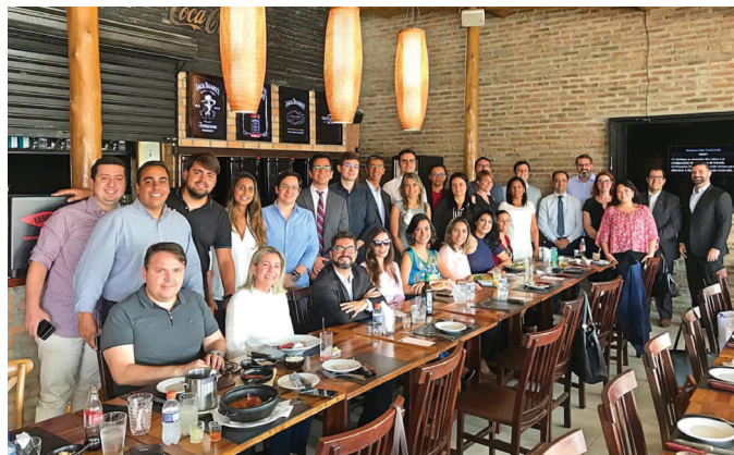
REUNIÃO DA SECCIONAL

Internacional, Idealizador & Desenvolvedor da metodologia ICAP - Integrity Coefficient Analysis Protocol, que visa identificar através da investigação científica da conduta não verbal vestígios sólidos para identificar, mapear, quantificar e evidenciar indícios de conduta dissimulativa, Autor do Livro “Técnicas de interrogatório – Aplicações no Contexto Policial”, pela Editora Ixtlan. A reunião contou com a presença de diversas autoridades da Justiça Criminal, Polícias Civil e Federal, além de representantes da Segurança e Defesa Social do Estado da Paraíba.