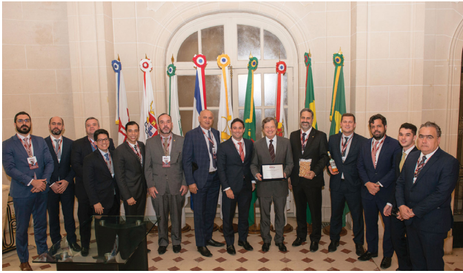
VISITA EMBAIXADA DO BRASIL NA FRANÇA