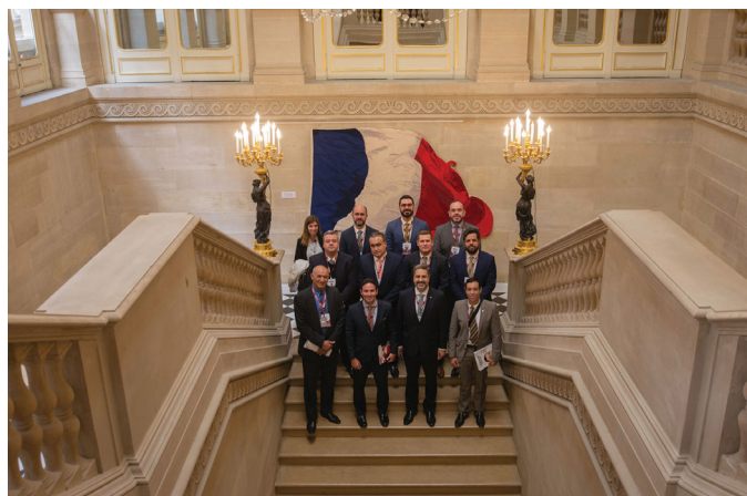
VISITA CONSELHO COSTITUCIONAL FRANCÊS RED

1. Visita ao escritório King and Spalding – 10hs (Endereço: 12 Cours Albert 1er, 75008 Paris)