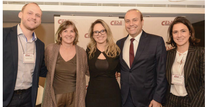
REUNIÃO DE ASSOCIADAS