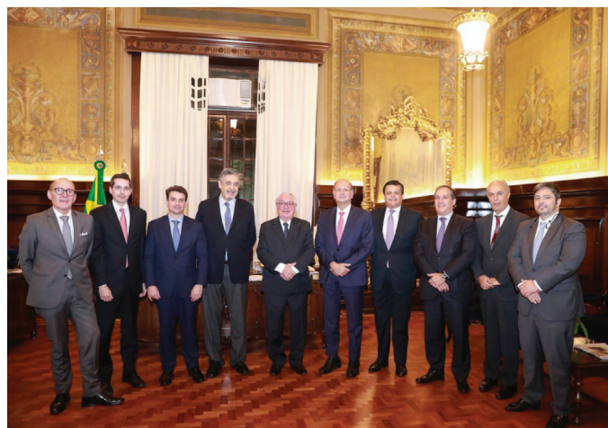
VISITA INSTITUCIONAL AO TRIBUNAL DE JUSTIÇA DE SÃO PAULO

08/11 – I Encontro das Sociedades de Advogados do Sul e Sudeste, em Florianópolis /SC.