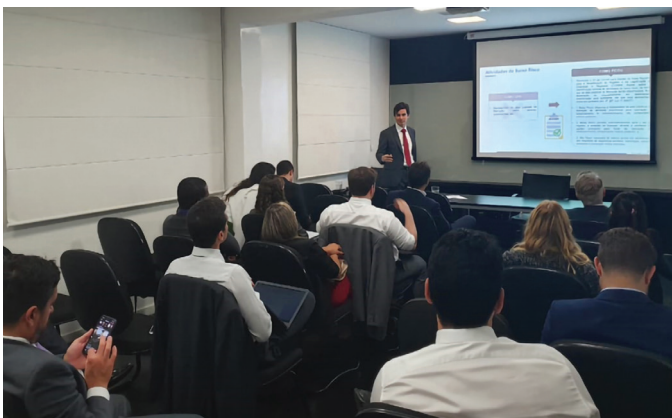
REUNIÃO DA SECCIONAL

28/11/2019 - Realização do "VI Seminário Mineiro de Sociedades de Advogados e de Advocacia Corporativa", em parceria com a CAC - Comissão da Advocacia Corporativa da OAB/MG, na Sede da OAB/MG, conforme programação abaixo: