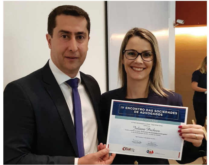
REUNIÃO DA SECCIONAL

20/09/2019 - Realização do "IV Encontro das Sociedades de Advogados", em parceria com o Comitê de Sociedades de Advogados, na Sede da OAB/MG, conforme programação abaixo: