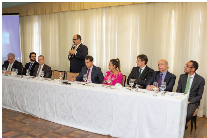
REUNIÃO DA SECCIONAL