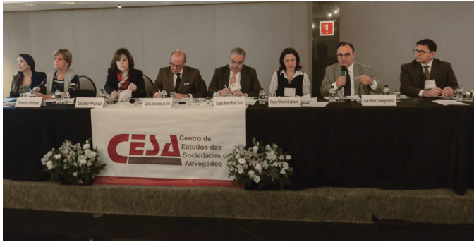
REUNIÃO DE ASSOCIADAS

29/06 – Nota pública do CESA contra a extinção do Conselho de Contribuintes (“CCERJ”), órgão paritário que funciona como segunda instância do contencioso administrativo tributário estadual.