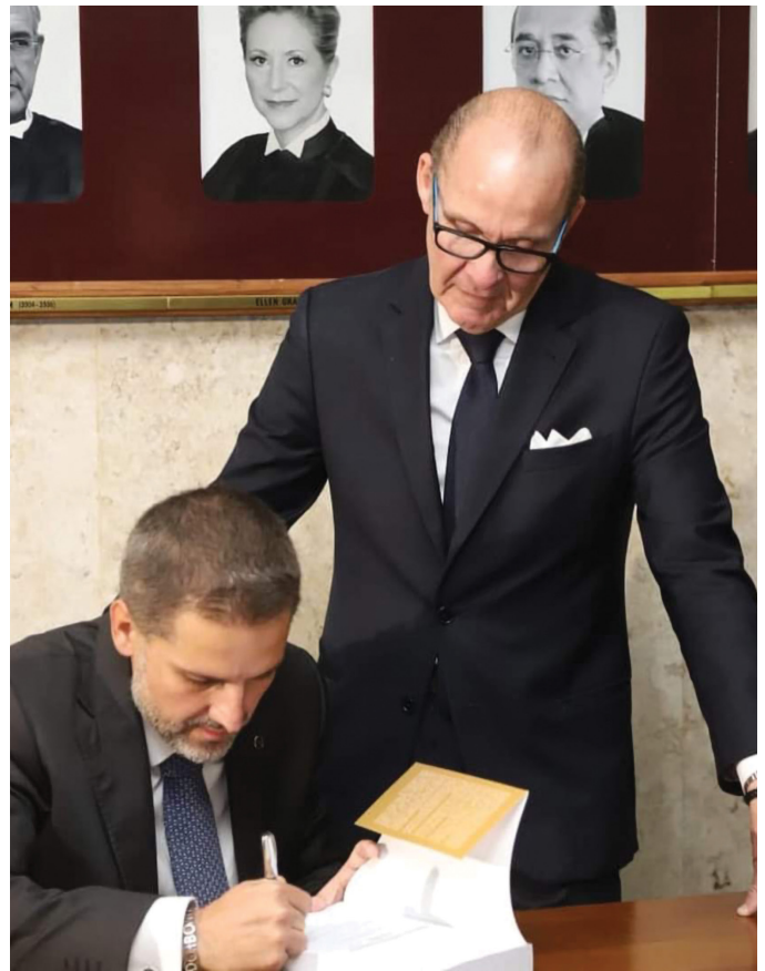
LANÇAMENTO DO LIVRO EMENDA CONSTITUCIONAL Nº 452004

10/12 – Lançamento do livro "Emenda Constitucional nº 45/2004: 15 Anos do Novo Poder Judiciário", organizado pelo Conselho Nacional de Justiça e pelo Conselho Federal da OAB.