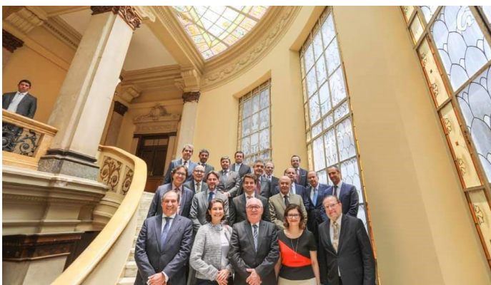
CESA E OUTRAS ENTIDADES NO TJSP