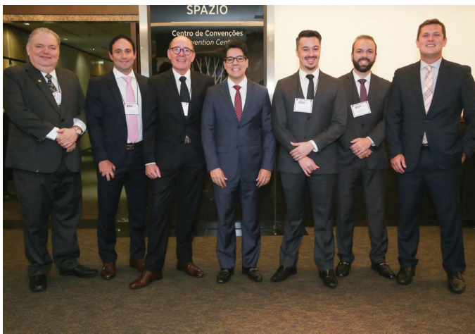
III ENCONTRO DE SOCIEDADES DE ADVOGADOS DO NORTE E NORDESTE

04/10 – III Encontro de Sociedades de Advogados do Norte e Nordeste, em Fortaleza/CE.