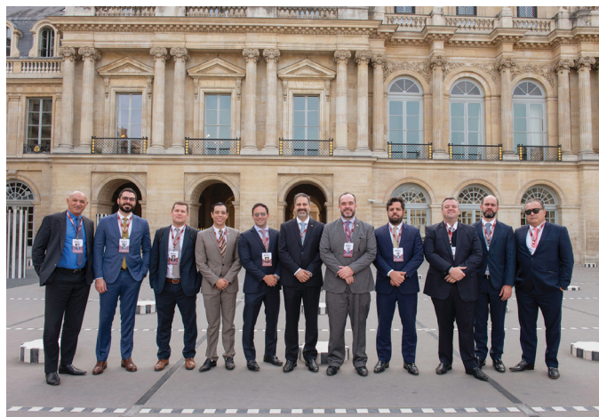
VISITA CONSELHO CONSTITUCIONAL FRANCÊS RED