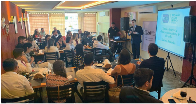
REUNIÃO DA SECCIONAL