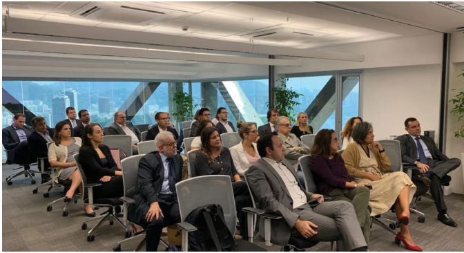
REUNIÃO DO COMITÊ RJ