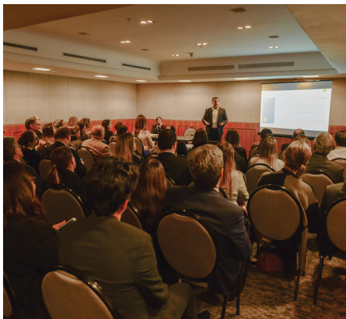
REUNIÃO DO COMITÊ SP