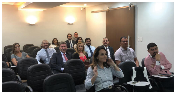
REUNIÃO DA SECCIONAL