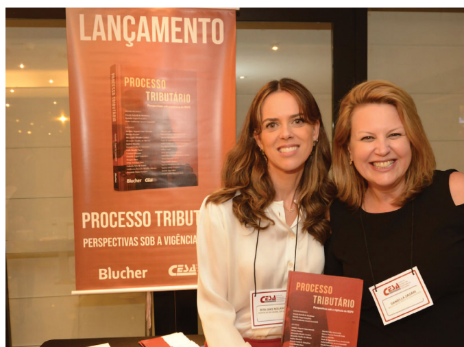
LANÇAMENTO DO LIVRO “PROCESSO TRIBUTÁRIO”