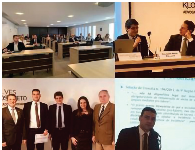
REUNIÃO NO ESCRITÓRIO ASSIS GONÇALVES, KLOSS NETO E ADVOGADOS ASSOCIADOS

Tema: “Pró-Labore, Dividendos e Contribuição Previdenciária nas Sociedades de Advogados”