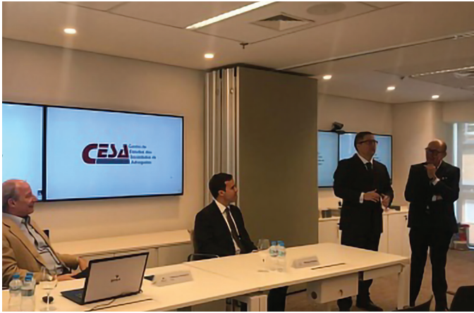
REUNIÃO SECCIONAL RIO DE JANEIRO

15/05 – Reunião com a FGV-SP para tratar da expansão do Projeto Incluir Direito e realização de atividades conjuntas.