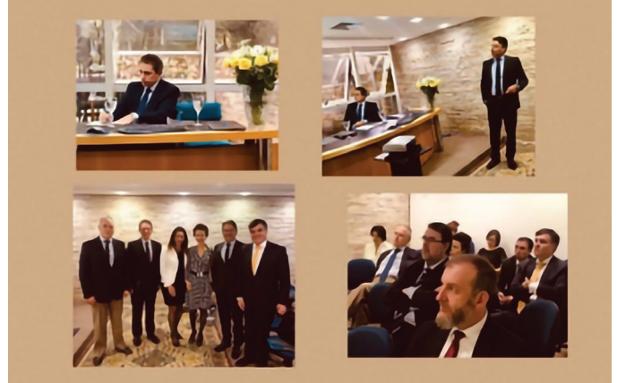
REUNIÃO NO ESCRITÓRIO PEREIRA GIONEDIS ADVOGADOS