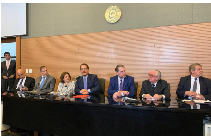
CENTENÁRIO DO DEPARTAMENTO JURÍDICO XI DE AGOSTO