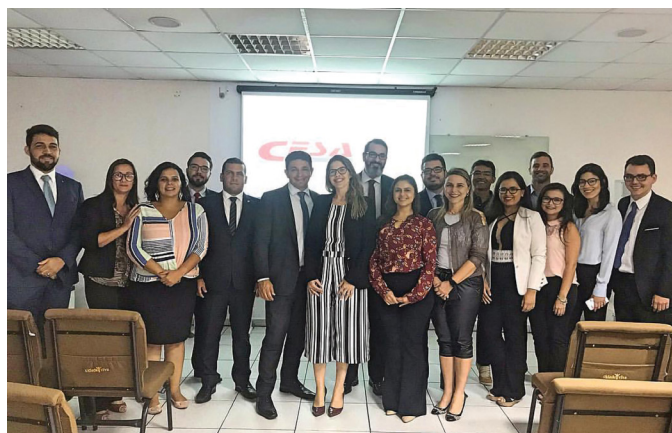
REUNIÃO DA SECCIONAL