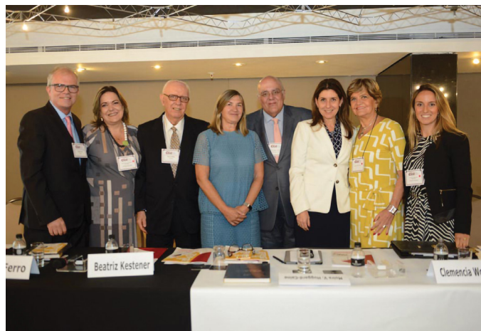
REUNIÃO DE ASSOCIADAS