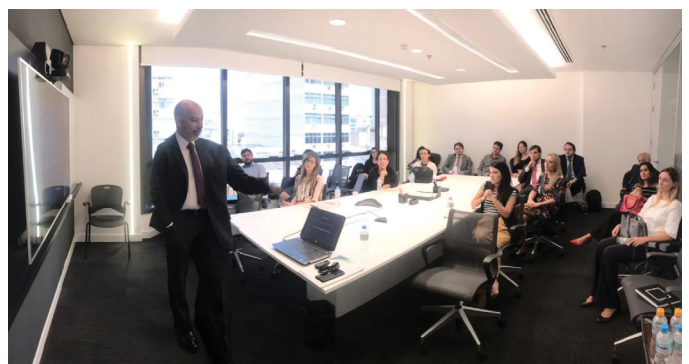
REUNIÃO DO COMITÊ RJ