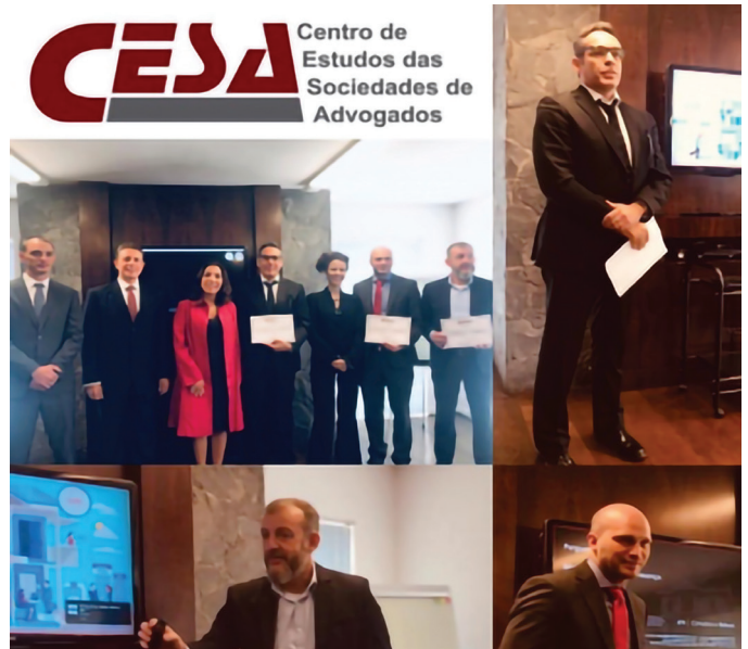
REUNIÃO NO ESCRITÓRIO ABREU MERKL E ADVOGADOS ASSOCIADOS