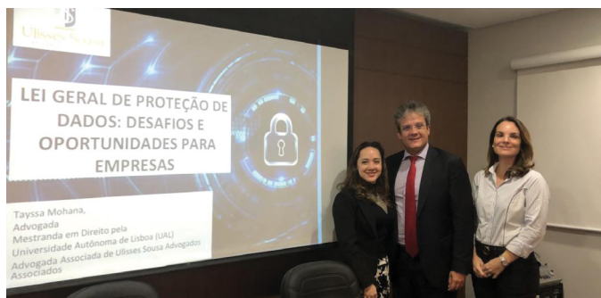
REUNIÃO DA SECCIONAL