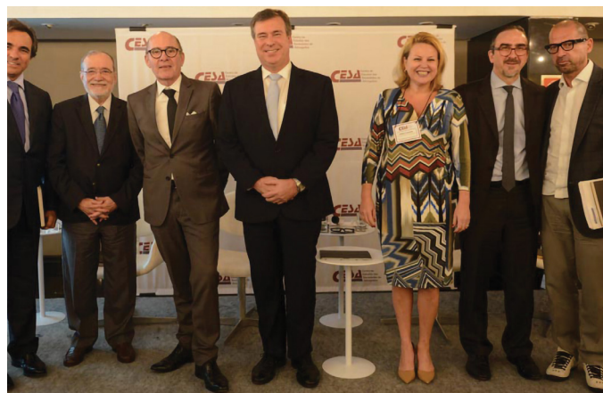
REUNIÃO DE ASSOCIADAS