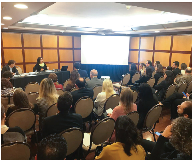
REUNIÃO DO COMITÊ SP