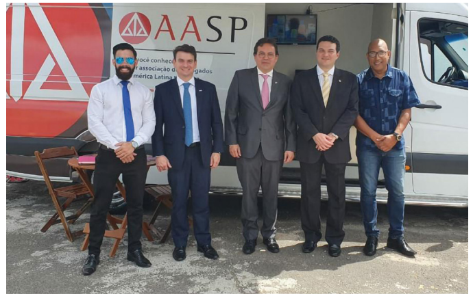
PARCERIA CESA AASP