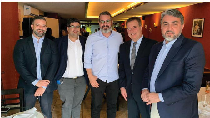
REUNIÃO DA SECCIONAL