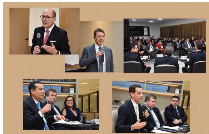
REUNIÃO NO ESCRITÓRIO GAIA, SILVA E GAEDE ASSOCIADOS

Tema: “Notas Fiscais nas Sociedades de Advogados e a Ameaça de Extinção dos Conselhos de Contribuintes”