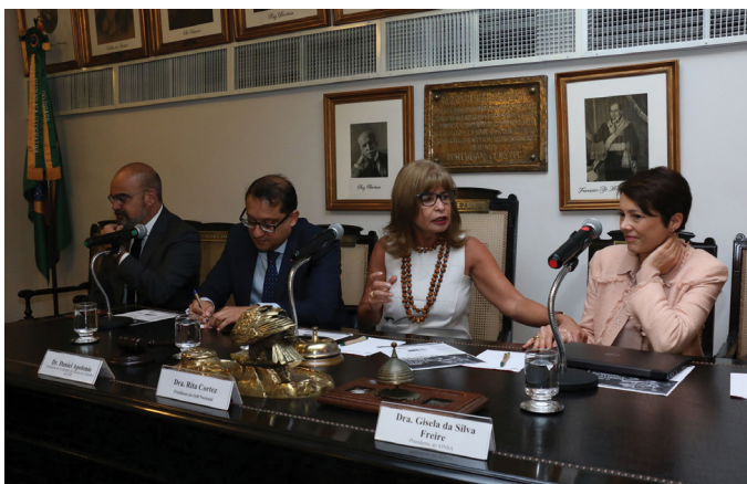
REUNIÃO DO COMITÊ RJ