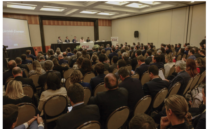
REUNIÃO DE ASSOCIADAS

29 a 31/08 – 10º Encontro Anual da AASP e VI Colóquio sobre o Supremo Tribunal Federal, em Campos do Jordão/SP.