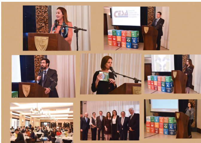
REUNIÃO NO GRACIOSA COUNTRY CLUB

Tema: “50 Anos da Convenção Americana de Direitos Humanos” e Assinatura das sociedades de advogados aderentes ao Pacto Global das Nações Unidas.