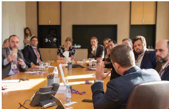
VISITA ESCRITÓRIO KING & SPALDING RED