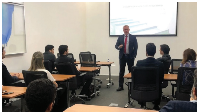
REUNIÃO DA SECCIONAL