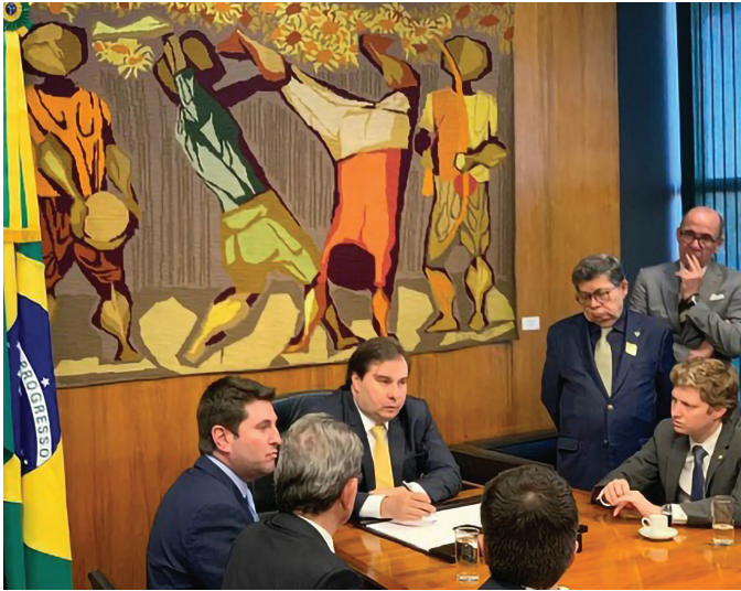
ACOMPANHAMENTO DA MP DA LIBERDADE ECONÔMICA

13 e 14/08 – Agenda em Brasília para acompanhamento da votação da MP da Liberdade Econômica.