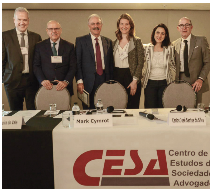
REUNIÃO DE ASSOCIADAS