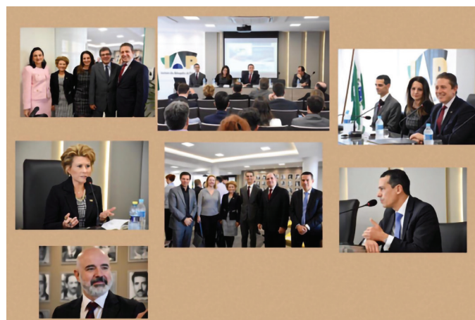
REUNIÃO NO IAP – INSTITUTO DOS ADVOGADOS DO PARANÁ

Tema: “A Função dos Conselhos de Contribuintes no Contencioso Administrativo”