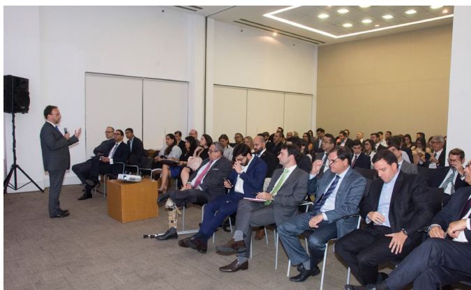
INSTALAÇÃO COMITÊ TECNOLOGIAS