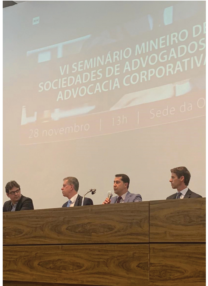
REUNIÃO DA SECCIONAL

03/12/2019 – Participação na Festa Anual de Encerramento das Atividades do CESA nacional, no Jockey Clube de São Paulo, com a presença de vários diretores do CESA/MG e de advogados de Minas Gerais.