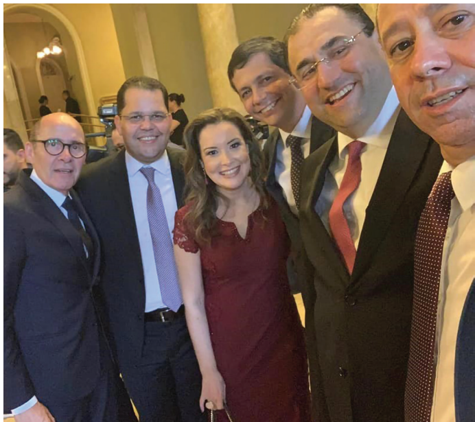
POSSE NOVA DIRETORIA DA OAB PARÁ

18/01 – Cerimônia de Posse da nova Diretoria da OAB/PA.