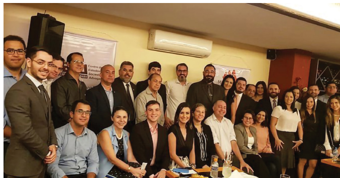
REUNIÃO DA SECCIONAL