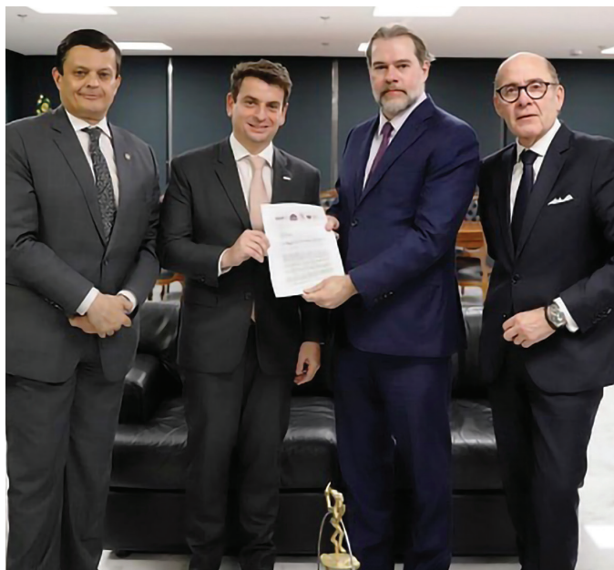
ENTREGA DE OFÍCIO EM CONJUNTO (OABCF, CESA, AASP E IASP)

23/09 – Audiência com o Ministro Dias Toffoli, presidente do STF, para entrega de ofício conjunto (OABCF, CESA, AASP e IASP), a respeito dos percalços que subsistem no acompanhamento da Pauta de Julgamentos da Sessão Plenária, especialmente quanto à inclusão de processos em listas e àqueles pautados em ambiente virtual.