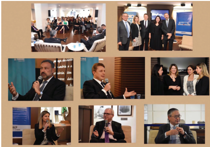
REUNIÃO NA ARBITAC – ASSOCIAÇÃO COMERCIAL DO PARANÁ

Tema: “Talk show Atualidades da Arbitragem”