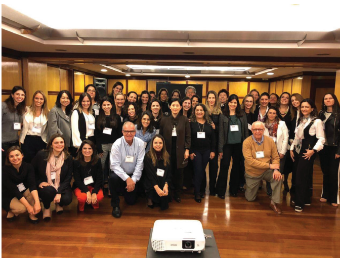
WORKSHOP I MÓDULO LIDERANÇA FEMININA

26/08 – Realização do I Módulo do Workshop Liderança Feminina, idealizado pelo Comitê de Administração e Ética Profissional - CADEP em parceria com a CEOlab.