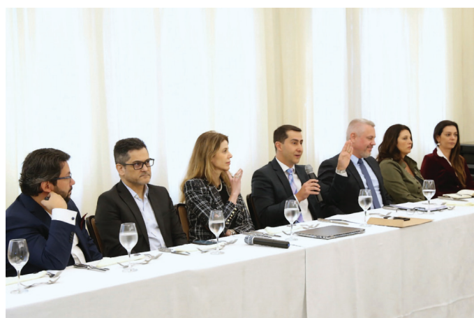
REUNIÃO DA SECCIONAL