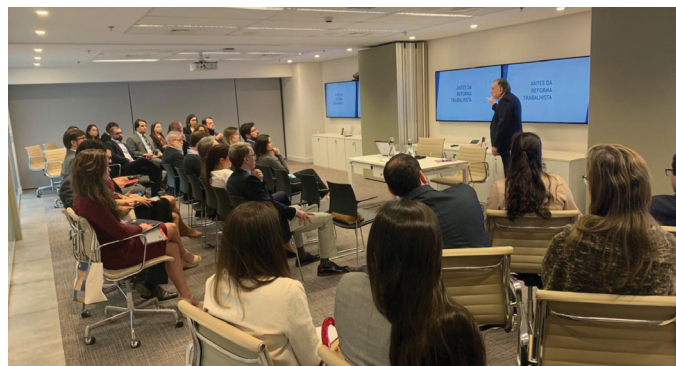
REUNIÃO DO COMITÊ RJ