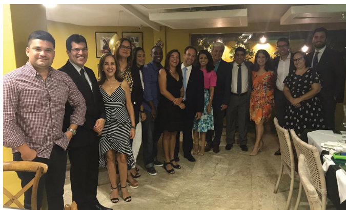
INSTALAÇÃO COMITÊ EMPRESARIAL