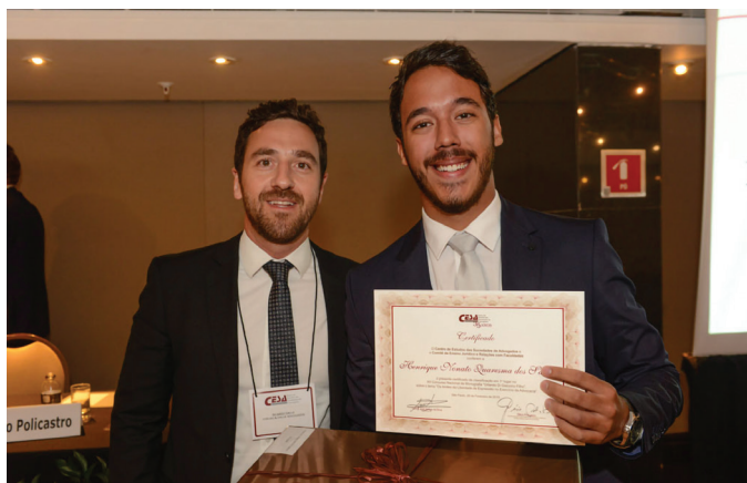
PREMIAÇÃO CONCURSO DE MONOGRAFIA