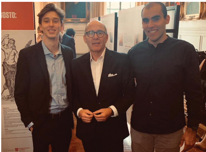
CENTENÁRIO DO DEPARTAMENTO JURÍDICO XI DE AGOSTO