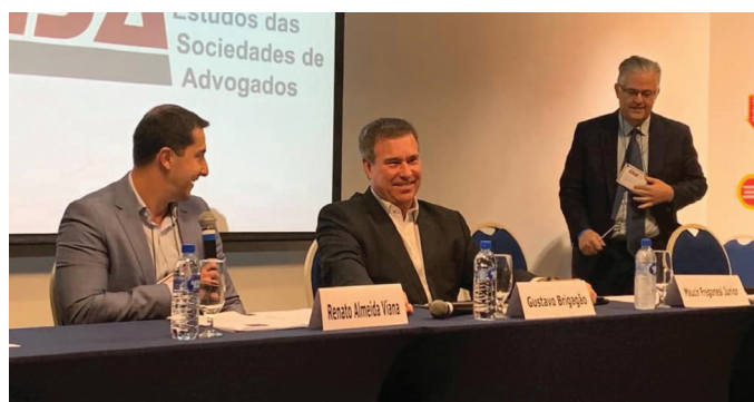
REUNIÃO DA SECCIONAL

19/11/2019 - Realização do “ I Encontro das Sociedades de Advogados do Sul e do Sudeste ”, em parceria com as seccionais do Sul e do Sudeste do CESA. O seminário abordou vários temas de interesse das Sociedades de Advogados, a saber: A Nova Lei de Liberdade Econômica e as Transformações no Código Civil Brasileiro; Temas Polêmicos da Tributação das Sociedades de Advogados; A Lei Geral de Proteção de Dados e as Sociedades de Advogados; Relacionamento entre Sociedades de Advogados e Departamentos Jurídicos; Reforma do Provimento 94/2000 da OAB – Publicidade e Propaganda na Advocacia; e A Advocacia na Atualidade.