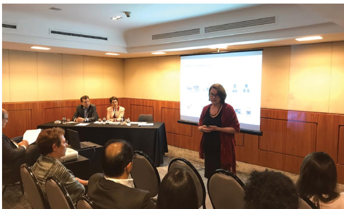
REUNIÃO DO COMITÊ SP