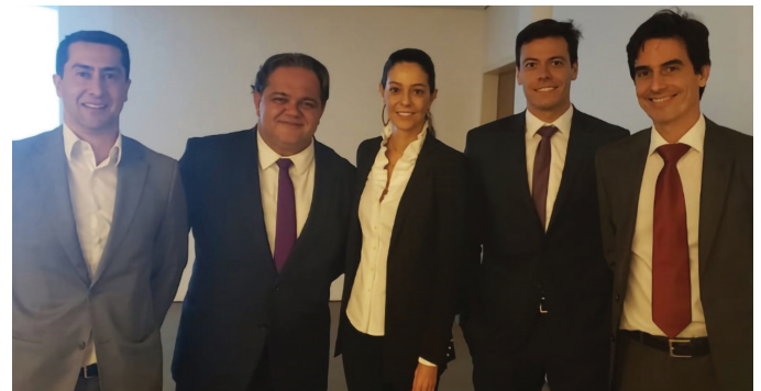
REUNIÃO DA SECCIONAL