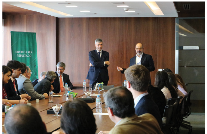
REUNIÃO DO COMITÊ RJ