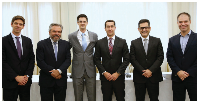
REUNIÃO DA SECCIONAL