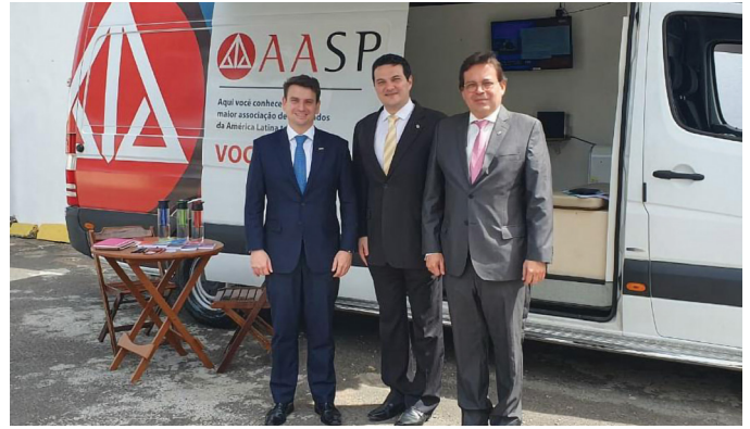
PARCERIA CESA AASP

No ano que se inicia, teremos novos desafios, mas contamos com a união de todos, para juntos, ampliarmos nossa atuação, sempre focando na melhora da qualidade e produtividade dos nossos associados.