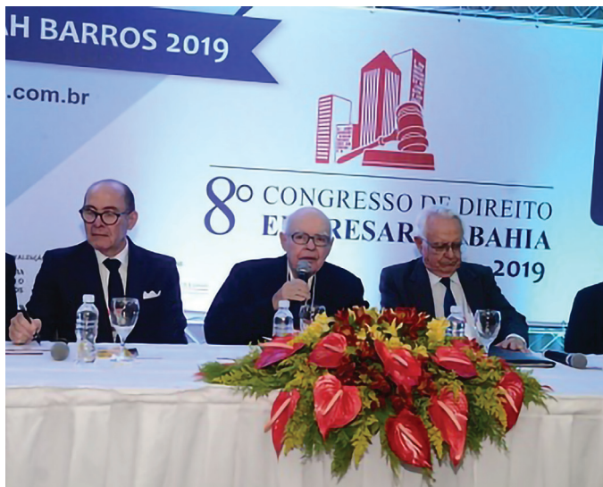
PARTICIPAÇÃO NO 8º CONGRESSO DE DIREITO EMPRESARIAL DA BAHIA