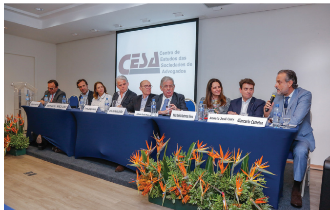
I ENCONTRO DAS SOCIEDADES DE ADVOGADOS DO SUL E SUDESTE EM FLORIANÓPOLIS