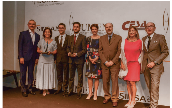
PREMIAÇÃO DA 3ª EDIÇÃO DO PRÊMIO LUMEN