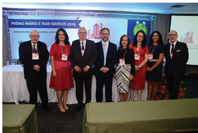
CONGRESSO DIR EMPRESARIAL