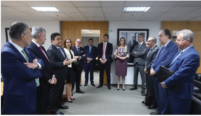
REUNIÃO DO CONSELHO FEDERAL DA OAB