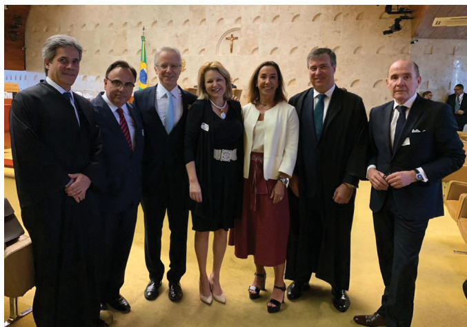
AUDIÊNCIA COM O PRESIDENTE DO STF, MINISTRO DIAS TOFFOLI

24/04 – Sessão extraordinária de julgamento no Plenário do Supremo Tribunal Federal (STF), na qual foi apreciado e provido o Recurso Extraordinário nº 940.769, para declarar a inconstitucionalidade de lei municipal, no caso, do Município de Porto Alegre, que estabelece impeditivos à submissão de sociedades profissionais de advogados ao regime de tributação fixa ou per capital com bases anuais na forma estabelecida no DL 406/68 (recepcionado pela Constituição Federal da República de 1988 com status de lei complementar nacional). Houve sustentação oral pelo CESA, que participou do processo como amicus curiae. Vitória da advocacia.