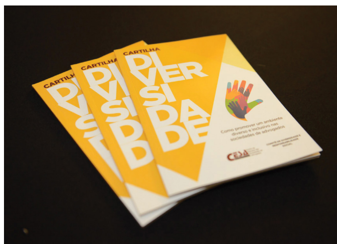
DISTRIBUIÇÃO CARTILHA DIVERSIDADE