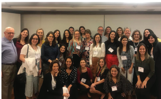
II MÓDULO DO WORKSHOP DE LIDERANÇA FEMININA

28/10 – II Módulo do Workshop de Liderança Feminina, organizado pelo CADEP, em parceria com a CEOLab.