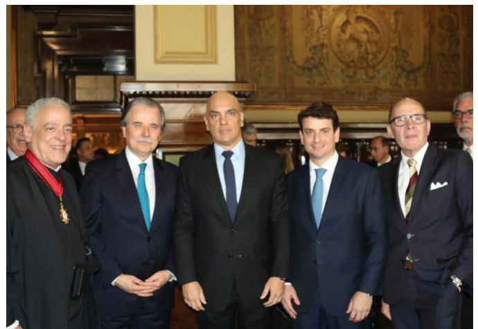
COLAR DO MÉRITO JUDICIÁRIO