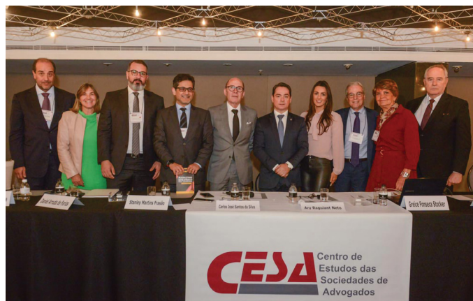
REUNIÃO DE ASSOCIADAS

08/11 – I Encontro das Sociedades de Advogados do Sul e Sudeste, em Florianópolis /SC.