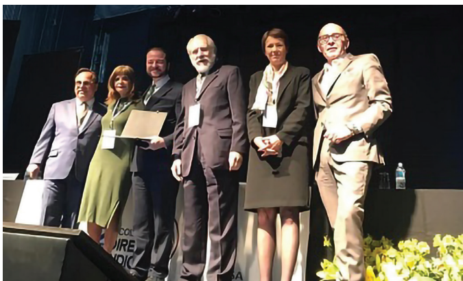
CERIMÔNIA DE ABERTURA DO 2º COLÓQUIO DE DIREITO SINDICAL DO SINSA

08/10 – Cerimônia de abertura do 2º Colóquio de Direito Sindical do SINSA e entrega da Medalha Prof. Amaury Mascaro Nascimento à sociedade de advogados Granadeiro Guimarães Advogados.