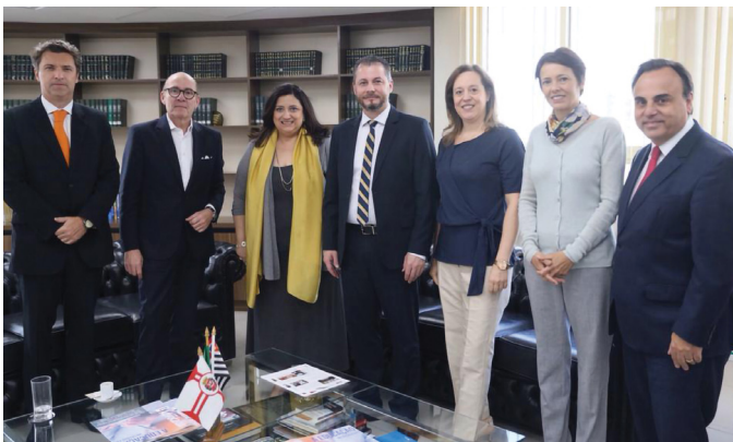
VISITA INSTITUCIONAL, EM CONJUNTO COM O SINSa, AO PRESIDENTE DA OABSP

21/05 – Visita institucional, em conjunto com o SINSa, a Diretoria da OAB/SP.