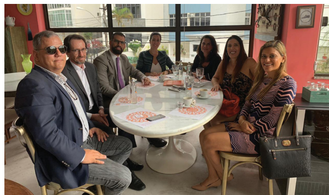
1ª REUNIÃO COMITÊ COMPLIANCE

Em 29/03/2019 foi a vez do Comitê Seccional de Compliance realizar a sua reunião. Após debaterem caso concreto pautado no Estatuto da Advocacia e em Provimento do Conselho Federal da OAB, os presentes passaram a definir a pauta de atuação do Comitê, que envolveu, prioritariamente, (a) a discussão sobre o Manual de Compliance que seria e foi posteriormente lançado pelo CESA Nacional em 2019; (b) a discussão sobre segurança de informação – alcance, cuidados exigidos das sociedades de advogados e formas de implementação de controles; (c) Lei Geral de Proteção de Dados – implicações para as sociedades de advogados, alcance legislativo e orientações as associadas; e (d) conflito de interesses e contaminação das sociedades por impedimentos de advogados/sócios.