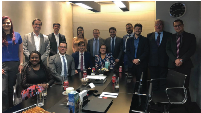
REUNIÃO DA SECCIONAL