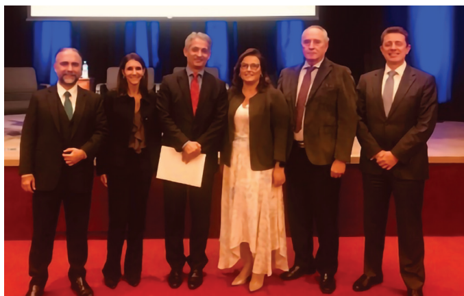
REUNIÃO NO ESCRITÓRIO CASILLO ADVOGADOS

Tema: “Talk Show sobre Medida Provisória de Liberdade Econômica”