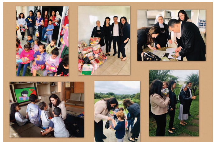
LAR MÃE MARIA

Entrega da Arrecadação de Natal - Lar Mãe Maria