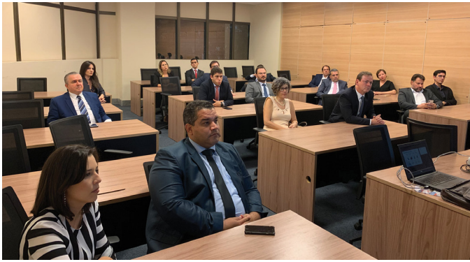
DESAFIOS NOS ESCRITÓRIOS